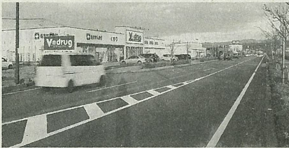
区域内を東西に貫く都市計画道路幸八幡線